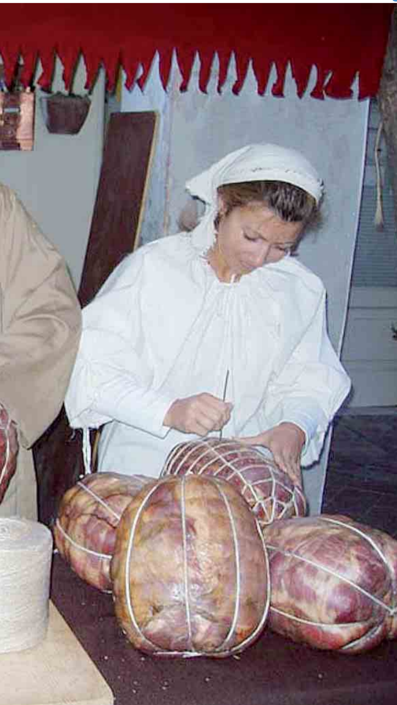
che ha conquistato anche Giuseppe Verdi

San Secondo capitale del gusto ma anche custode di tanti gioielli tutti da scoprire. Per i visitatori, oltre alla grande festa del "Ponte dei Sapori", alla Rocca dei Rossi e al divertimento, la possibilità di visitare un patrimonio straordinario. A cominciare dall'oratorio della Beata Vergine del Serraglio del 1685 decorato con stucchi e pregevoli affreschi. Interessante la Pieve di San Genesio, precedente al 1084, isolata tra campi e canali, in un contesto simile alla campagna medievale in cui è stata costruita quasi dieci secoli fa. Da vedere l'architettura dell'Ospedale fondato nel 1632, ma ancora incompleto nei primi anni del '700. La porta intagliata (secolo XVIII), immette nell'ex oratorio, coperto da una cupoletta con in altorilievo nei pennacchi i quattro Evangelisti in stucco, alla maniera di Luca e Leonardo Reti. La Chiesa dell'Annunziata, fondata come cappella nella prima metà del '400, raggiunge l'assetto attuale a tre navate nel '700. Infine, l'Oratorio di San Luigi, terminato nel 1728, fregiato di pregevoli stucchi di Ferraboschi e, nella volta, di una Trinità in gloria coi Santi Giovanni de Matha e Felice di Valois di Facchini. Coevi risultano gli altari lignei decorati. Per informazioni, l'ufficio Uit risponde allo 0521 873214 o allo 0521 872147.