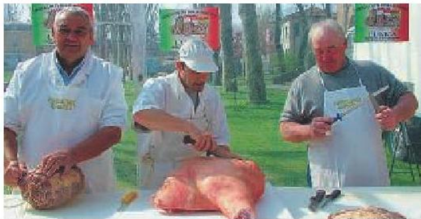
Tradizione Il programma prevede una «esibizione» di norcini.