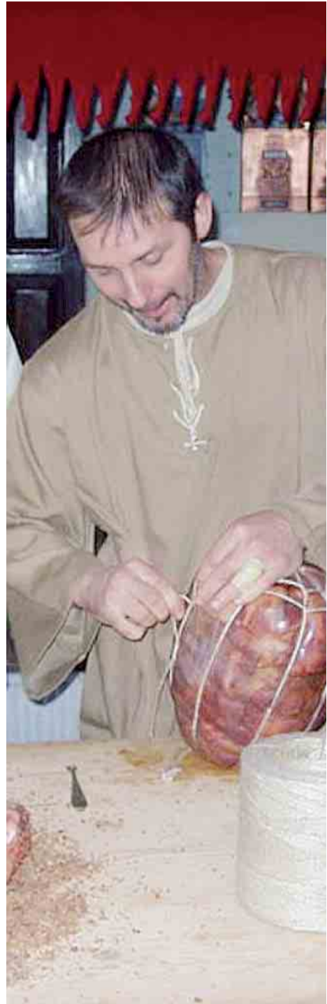
Spalla cotta, l'antico salume sansecondino