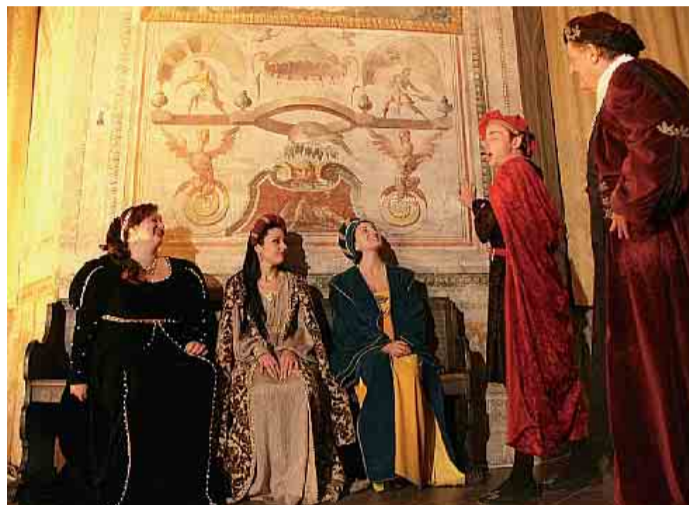
Rievocazioni storiche alla Rocca dei Rossi