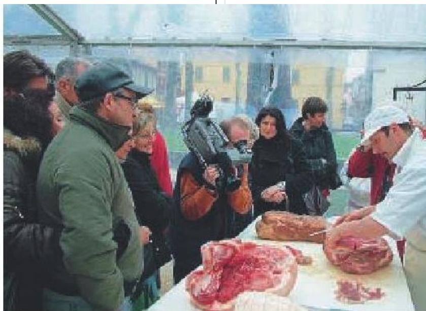
Ponte dei sapori Uno degli stand della rassegna gastronomica.