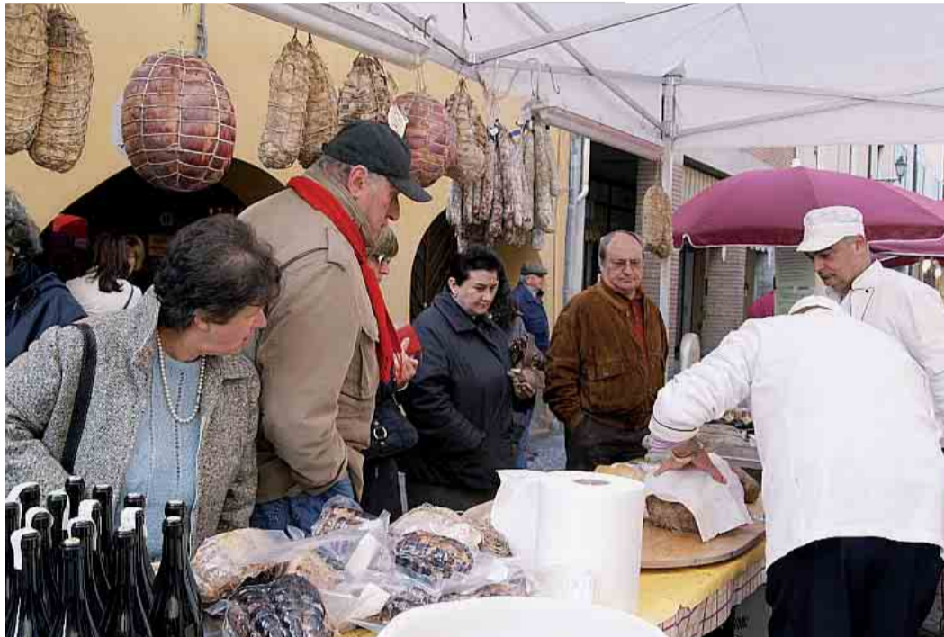
Lo stand della Spalla cotta di San Secondo preso d'assalto per la degustazione

L'evento promuove, valorizza, presenta e cucina i prodotti tipici del territorio, abbinando l'identità della Bassa all'enogastronomia di qualità, la riscoperta della cultura locale e le produzioni in loco, dunque l'acquisto e il consumo a Co2 zero. Parmigiano Reggiano, Culatello, Fiocchetto, Violino, Fortanina, Cotechino, Spalla Cotta, Oca, Zuccheri, Polenta, Bargnolino, le specialità più gettonate. A San Secondo e a Fontevivo, durante i weekend di festa, ci saranno degustazioni, cene, dimostrazioni di lavorazione all'aperto dei prodotti, mostre-mercato e mercatini biologici con