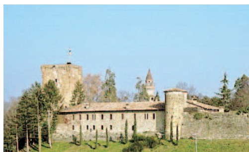
Il Castello di Agazzano (Piacenza)

A tavola sul «Ponte dei Sapori», Festival gastronomico-culturale della Bassa Parmense, Trecasali, info 0521-611921.